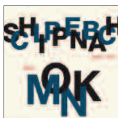
Alexander von Schlippenbach Schlippenbach Plays Monk