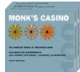
Monk's Casino The Complete Works of Thelonious Monk