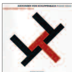
Alexander von Schlippenbach Twelve Tone Tales Vol 1 Twelve Tone Tales Vol 2