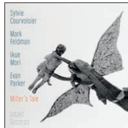
COURVOISIER - FELDMAN - PARKER - MORI MILLER'S TALE Intakt CD 270