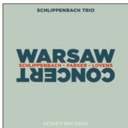
SCHLIPPENBACH TRIO WARSAW CONCERT Alexander von Schlippenbach Evan Parker, Paul Lovens Intakt CD 275