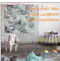
TOM RAINEY TRIO Ingrid Laubrock, Mary Halvorson HOTEL GRIEF Intakt CD 256