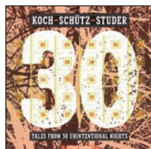
KOCH-SCHÜTZ-STUDER TALES FROM 30 UNINTENTIONAL NIGHTS Intakt CD 117