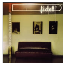
KOCH-SCHÜTZ-STUDER & MÚSICOS CUBANOS FÍDEL Intakt CD 056