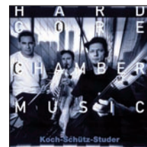
KOCH-SCHÜTZ-STUDER HARDCORE CHAMBERMUSIC Intakt CD 042